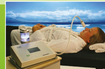
Fornitura Flex-Arm touch-free