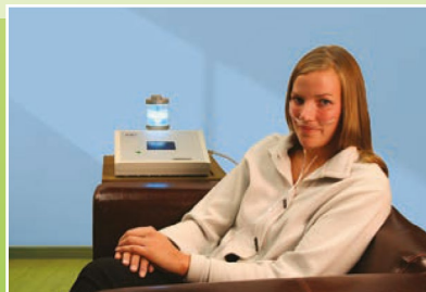
Fornitura di cannula nasale

- Cliente Eng3 con tre dispositivi NanoVi™, Vermont